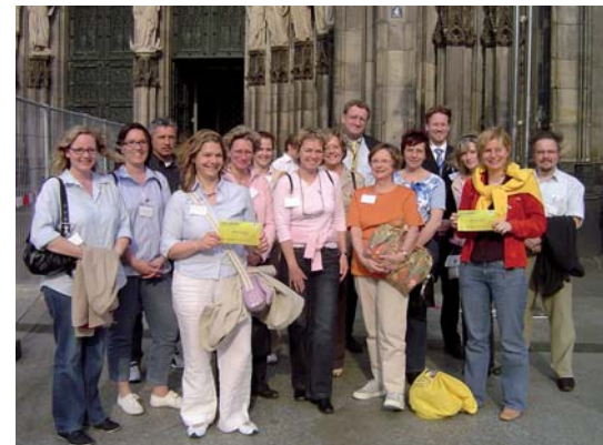
Fröhliche Gesichter bei der Dombaudachführung zum zehnjährigen Geburtstag von adevis.

Ein Rundgang an der Außenfassade und der Anstieg in den Turm des Dachfirstes rundeten das Programm ab. Wenngleich der Anstieg mühselig war, entschädigte doch der Blick von oben für alle Strapazen. Den Teilnehmerinnen und Teilnehmern jedenfalls wird die Dombaudachführung in bester Erinnerung bleiben. Und auf diejenigen, die nicht dabei sein konnten, warten ja noch eine Reihe weiterer Attraktionen der Reihe „Kölle – querbeet“ (siehe KurzNews). ■